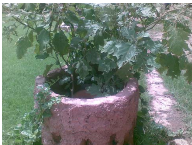
Figure 1 : Dispositif de recyclage des eaux résiduaires pour la petite irrigation (siège du CREPA)